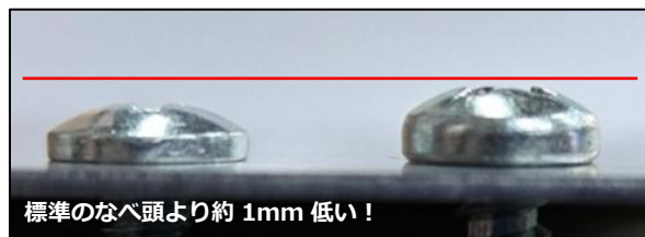
標準のなべ頭より約 1mm 低い！